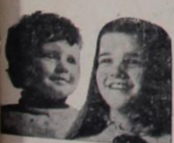
FULANINHO & BELTRAMINHA

SEJA AMIGO DO QUE É SEU, PARTICIPANDO DO PROGRESSO A CRESCIMENTO DO NOSSO ESTADO. FAÇA EMPRESTIMOS NO BANCO DO ESTADO DO PIAUÍ — O BANCO QUE MAIS CRESCE NO NORDESTE — MAS TAMBÉM DEPOSITE NO BEP. AS SUAS ECONOMIAS DUAS AGENCIAS PARA MELHOR LHE SERVIR: RUA ANTONINO FREIRE (ONDE FUNCIONOU A AGENCIA FORD) E RUA BARROSO (AO LADO DA RADIO CLUBE DE TERESINA)